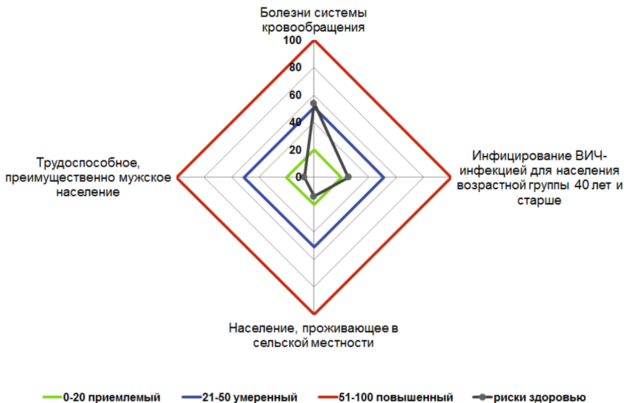
Рис. 2. Оценка потенциальной степени рисков популяционному здоровью в Узденском районе в 2021 году